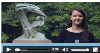
Video informativo sobre el Currículo Europass