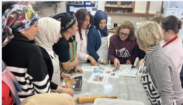
Elaboración de paella valenciana