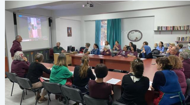
Fósiles del siglo XX