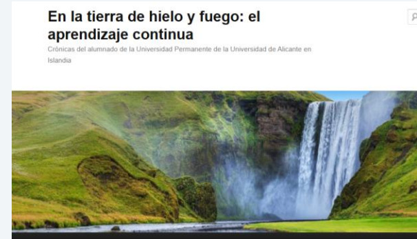
Movilidad a Islandia