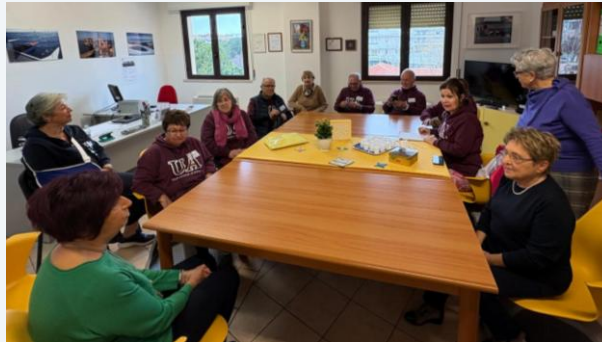
Emociones de la música