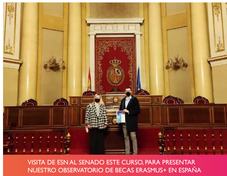
VISITA DE ESN AL SENADO ESTE CURSO, PARA PRESENTAR NUESTRO OBSERVATORIO DE BECAS ERASMUS+ EN ESPAÑA

En nuestro calendario, incluiremos varias campañas de difusión de los documentos de posicionamiento que realizamos, como es el caso de nuestra propuesta de una asignatura sobre ciudadanía europea, cuyo documento está disponible en nuestra web, y que expusimos en un webinar organizado por el Parlamento Europeo (concretamente por el eurodiputado Domènec Ruiz) el pasado 26 de marzo.