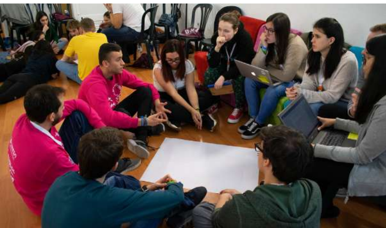
TALLER FORMATIVO PARA PERSONAS VOLUNTARIAS DE ESN ANTES DE LA PANDEMIA

Cuando se llega a una ciudad desconocida es normal sentir esa sensación de vértigo que a veces te hace replantearte si has cometido un error. En esos momentos, es cuando las personas voluntarias de ESN actúan como red de seguridad, ayudando a estudiantes de todo el mundo durante esos primeros días de su experiencia Erasmus.