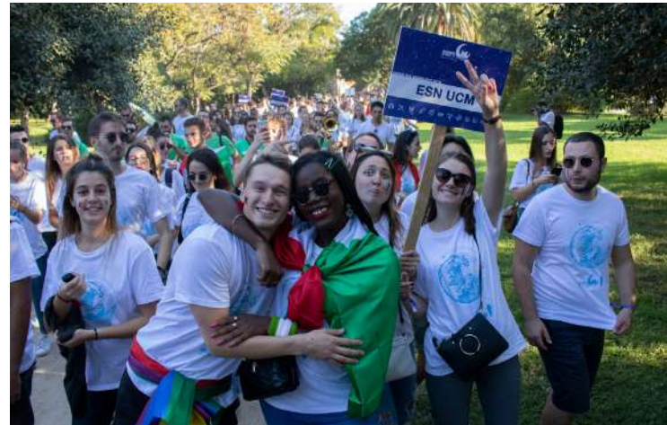
EVENTO NACIONAL ANTES DE LA PANDEMIA, EN LA QUE SE REUNÍAN ESTUDIANTES INTERNACIONALES DE TODA ESPAÑA

valores es muy estrecho, por lo que intentamos que cada vez sea un Programa más inclusivo y al alcance de más gente.