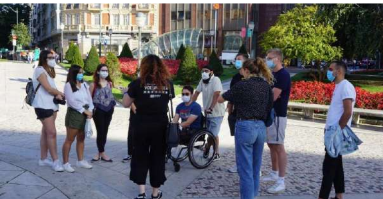
CITY TOUR ADAPTADO A LA COVID-19 EN UNA SECCIÓN LOCAL

En todos los países en los que ESN tiene presencia, se busca mantener una colaboración fluida de apoyo institucional y promocional, y en ESN España estamos muy felices por la buena relación que desde hace años mantienen las dos entidades. La principal colaboración consiste en la difusión y promoción conjunta del programa Erasmus+ y las oportunidades de movilidad entre la población española. La mayoría de personas voluntarias de ESN España somos jóvenes Erasmus Alumni que deseamos que todo el mundo pueda disfrutar de la misma experiencia, y para ello realizamos campañas en redes sociales, organizamos actividades de divulgación donde contar testimonios, creamos herramientas como la calculadora web de becas y el Observatorio de becas Erasmus+, etc. En todas estas iniciativas, el SEPIE nos da un inestimable apoyo en la difusión de las mismas, además de trasladarnos su opinión. De igual manera, desde ESN España promocionamos las iniciativas de comunicación del SEPIE, como sus Cafés Viajeros Erasmus+, jornadas y eventos.