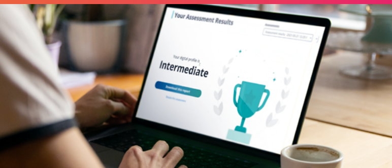
PANTALLA DE CONFIRMACIÓN DEL RESULTADO