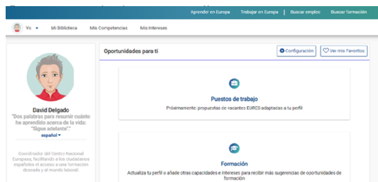
ESCRITORIO DE USUARIOS REGISTRADOS EN EUROPASS

Como sabrás, desde el escritorio de la cuenta Europass se puede acceder cómoda y rápidamente a todas y cada una de las herramientas digitales y posibilidades que ofrece el Portal a los ciudadanos registrados (editor de CV, editor de cartas de presentación, biblioteca personal, buscador de oportunidades de trabajo y de estudios en Europa, sugerencias personalizadas de empleo y formación, etc.). A dicho escritorio se incorporará, próximamente, un acceso directo al test de autoevaluación de la competencia digital, explicado anteriormente. Aprovechando la incorporación de esa nueva herramienta, Europass quiere renovar el escritorio de los usuarios y ofrecer una apariencia más moderna, práctica y con estilo propio.