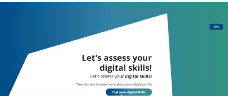
PANTALLA AL INICIO DE LA REALIZACIÓN DEL TEST

Durante los meses de verano, la Comisión Europea estuvo probando esta nueva herramienta con voluntarios de todos los países europeos y próximamente se lanzará a todos los ciudadanos de Europa, a través del Portal Europass. Además, estará disponible en 29 idiomas.