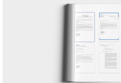
PLANTILLAS ACTUALES DE CARTAS DE PRESENTACIÓN EUROPASS