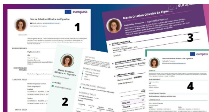
PLANTILLAS ACTUALES DE CV EUROPASS

Los usuarios de Europass demandaban una mayor autonomía para poder editar sus currículums y sus cartas de presentación acorde con sus gustos y preferencias. Para dar respuesta a esta petición, Europass ha puesto a su disposición una cuarta plantilla, tanto en el editor de CV como en el editor de cartas de presentación.