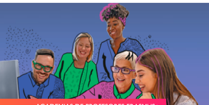
ACADEMIAS DE PROFESORES ERASMUS+

Teniendo en cuenta las decisiones tomadas para la construcción del Espacio Europeo de Educación 2025, el Plan de Acción de Educación Digital 2021-2027 y además, para dar respuesta a problemas y retos identificados a nivel europeo, tales como: el envejecimiento de los profesionales docentes; la grave escasez de profesores; la percepción del profesorado de que existe escasez de oportunidades de desarrollo profesional; y la falta de integración de la movilidad en la formación del profesorado, las “Academias de profesores Erasmus+” surgen para dar respuesta a estas cuestiones, complementando la labor realizada en el marco de la creación del Espacio Europeo de Educación.