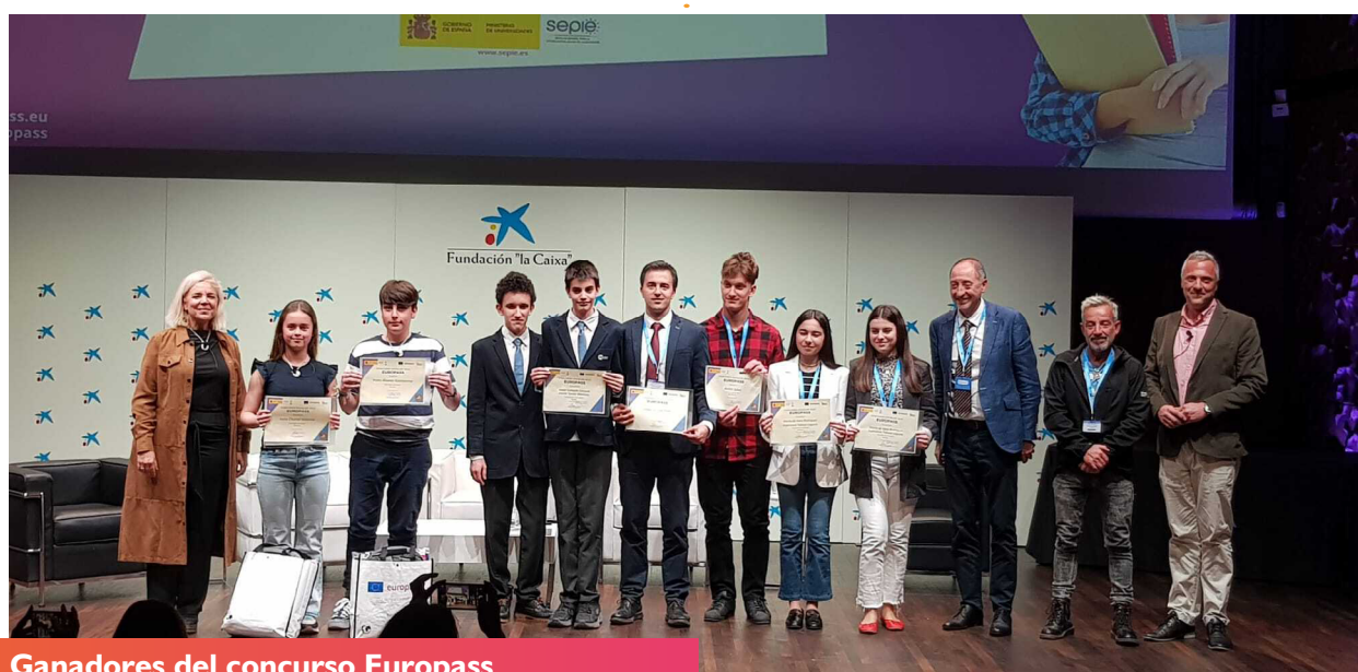
Ganadores del concurso Europass