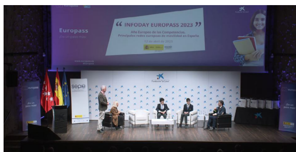
Salón de actos CaixaForum Madrid