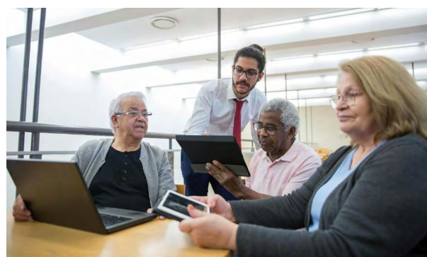
PIAAC mide competencias clave de adultos: lectura, matemáticas y resolución de problemas digitales

En este contexto, programas como Erasmus+ desempeñan un papel fundamental en la Educación de Personas Adultas . Según Tovar, “participar en experiencias internacionales permite no solo mejorar habilidades cognitivas, como la resolución de problemas o la capacidad de adaptarse a nuevas situaciones, sino también fortalecer competencias socioemocionales, como la autonomía, la comunicación intercultural, la colaboración o la gestión de la diversidad. Estas experiencias permiten aplicar directamente lo aprendido en la vida laboral y personal, promoviendo empleabilidad, movilidad profesional e inclusión social”.