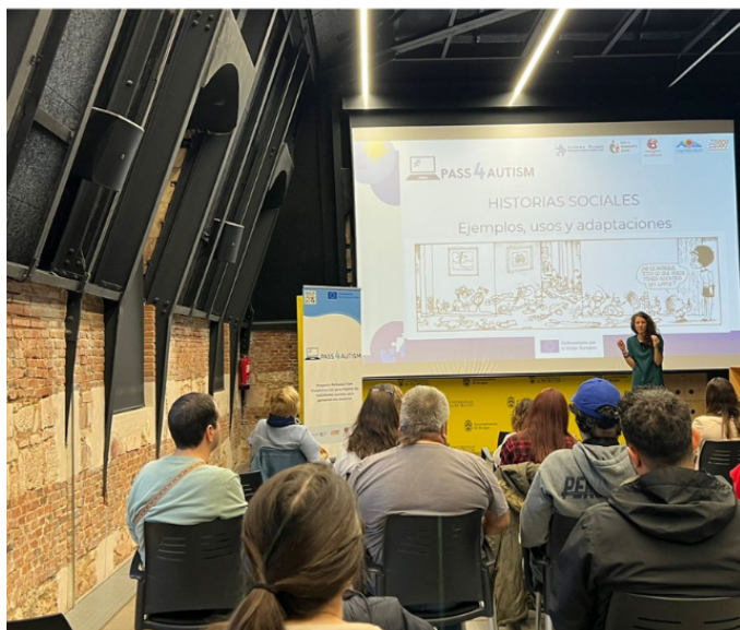
Representantes de las entidades socias y profesionales del proyecto durante una de las sesiones de trabajo transnacionales

Desde la asociación resaltan que las familias han sido las protagonistas principales de este proceso, participando activamente desde la detección inicial de necesidades hasta la evaluación de los materiales. “Ellas son quienes primero detectan necesidades y evalúan la utilidad que pueden dar a estas plataformas” , señalan, destacando que el impacto del proyecto va mucho más allá de la teoría al ofrecer estrategias eficaces para afrontar desafíos conductuales y adaptar los entornos.