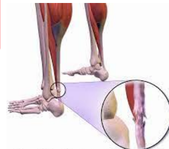
Rotura del tendón de Aquiles